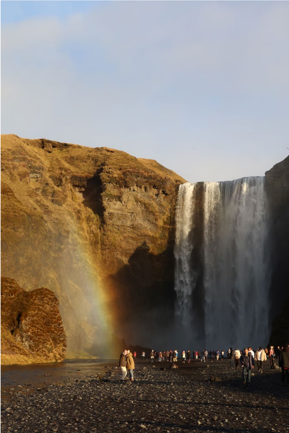
Skógafoss, Island, november 2023