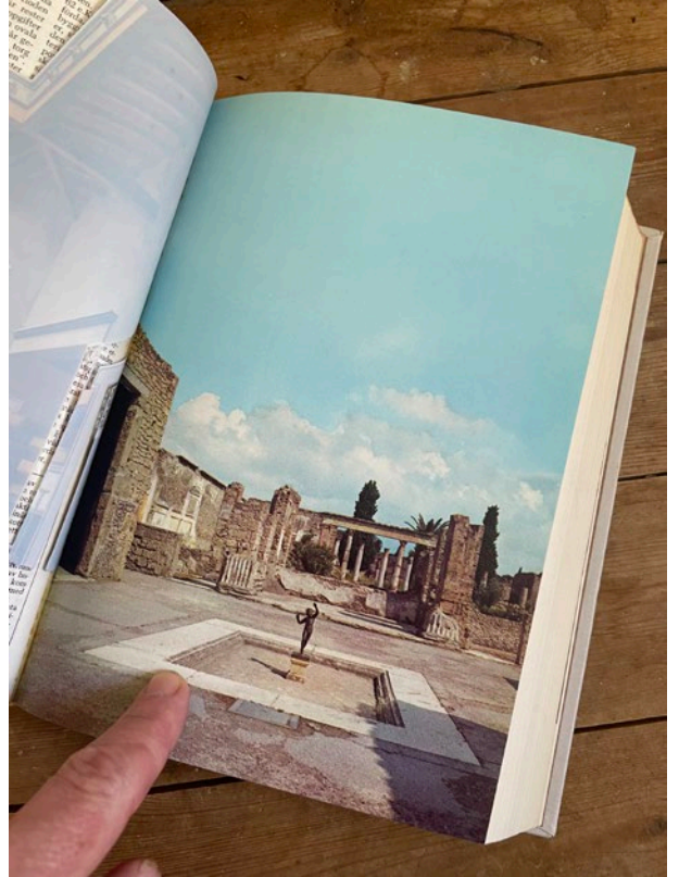
Bonniers lexikon, band 11, sida 452