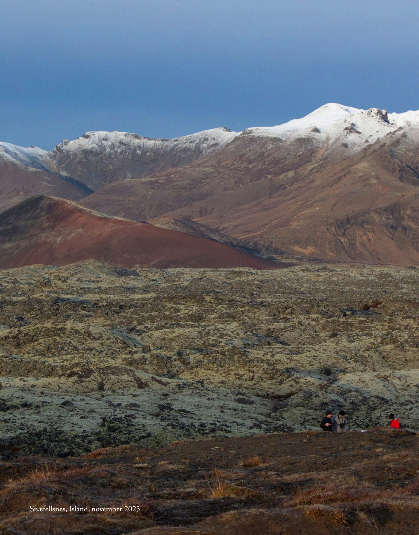
Snæfellsnes, Island, november 2023