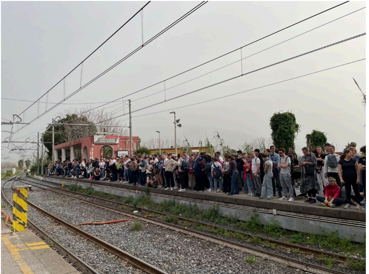
Pompei Scavi-stationen, Neapelbukten, mars 2024