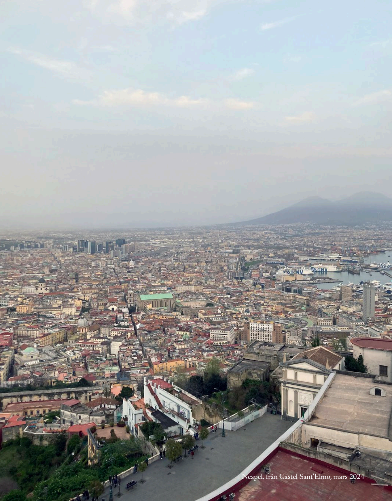
Neapel, från Castel Sant'Elmo, mars 2024