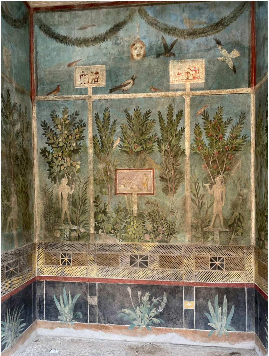
Väggmålning, Trädgårdsscen med egyptiska motiv och teatermask, Pompeji, april 2024