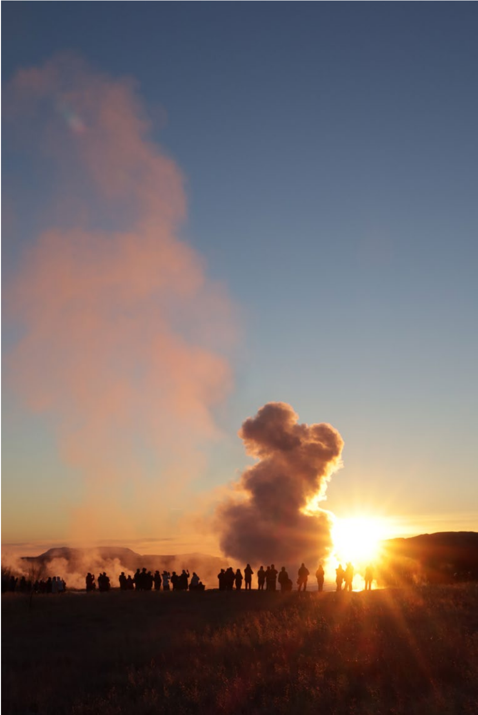
Geysir, Island, november 2023