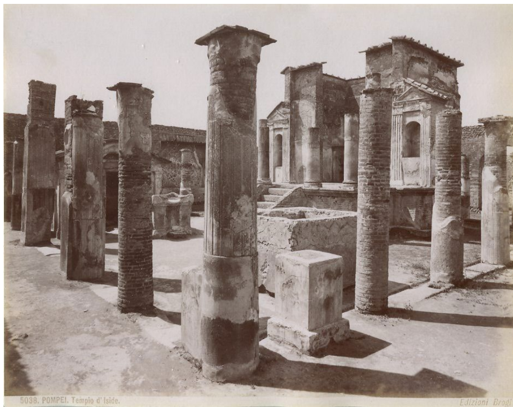
5038. POMPEI. Tempio d'Iside.